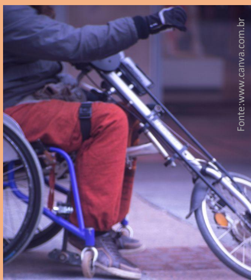
Bicicletas ergométricas adaptadas