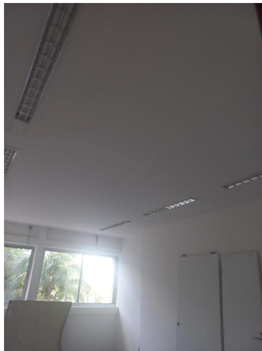
Figuras 4 a 11 – Salas (elétrica e piso)