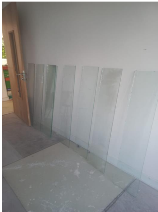
Figura 12 a 18 – Corredor com portas e piso.