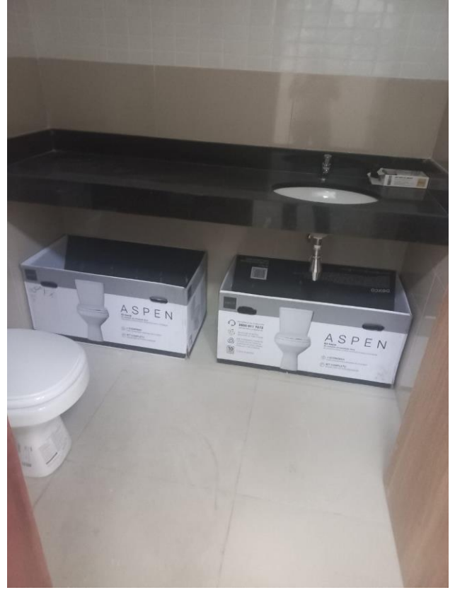
Figura 1 e 2 – Banheiros